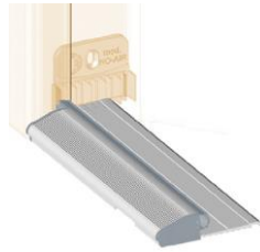
型號: Ulisse & No Air (提高隔音效果配件)